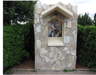
Nově vybudována křížová cesta (8.zastavení:Ježíš těší plačící ženy)