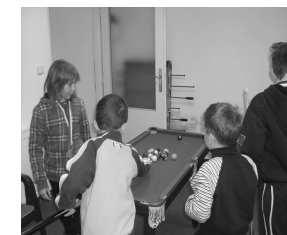
Učili jsme se chodit na chůdách.....a nechyběl fotbálek .....a oblíbený kulečník