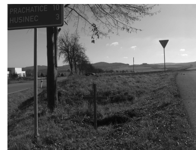
rozcestí u Chluman bez kříže a s již krásně obnoveným křížem

V roce 2010 byly obnoveny péčí dobrodinců tři kříže – na rozcestí ke Chlumanům, dále pak u Předslavic a poblíž Tvrzic. Zajímavé bylo, že po zabudování křížku u Předslavic (1), nechal brzy majitel přilehlého pozemku obnovit přeražený kříž na své parcele (obr. Předslavice 2). Římskokatolická farnost Vlachovo Březí děkuje všem dobrodincům, kteří se podíleli na obnově křížků a vyprošuje Boží požehnání pro ně a jejich blízké.