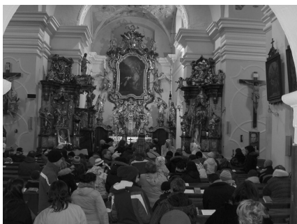
celkový pohled do kostela