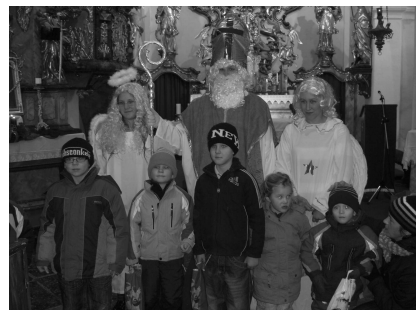
na závěr bylo možno se nechat vyfotit na památku s Mikulášem a anděly